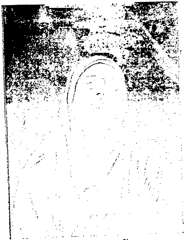
लक्ष्मण सरदार, पुरजमिह